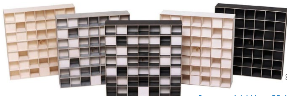
Panneaux Adelsklang QR-49.